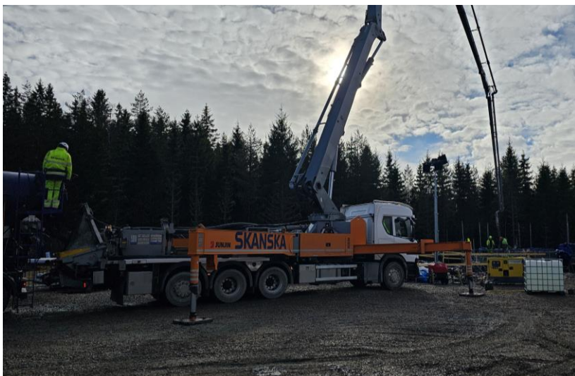
Bilden visar en betongpump som fyller på med ECO-betong vid gjutning av fundament.