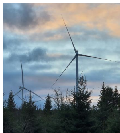
Foton tagna från Vattenfalls vindkraftpark Grönhult i Tranemo och Gislaveds kommuner.