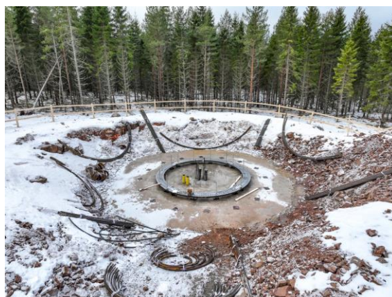
Bilden visar ett fundament där staghål är borrar och anchor cage ring är på plats.