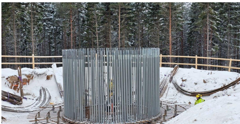
Bilden visar en anchor cage ring som kommit på plats.

Hör då av dig till Platschef Jan Juel på jan.juel@vattenfall.com eller +45 2787 5095.