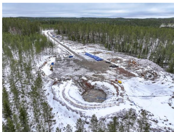
Bilden visar en av vindkraftparkens hårdgjorda ytor där avjämningsgjutning pågår.

Nästa steg i byggnationen är att fortsätta arbetet med att gjuta fundament.