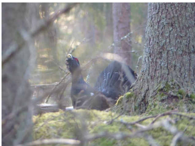
Tjädertupp i området för vindkraftpark Bruzaholm.

- Avsiktsförklaringen har ett väldigt spännande angreppssätt och jag hoppas (och tror) att det slår väl ut på så sätt att tjädern finns kvar i området även efter vindkraftsverkens byggnation och helst även ökar. Fortsatta inventeringar kommer förhoppningsvis ge svar på detta.