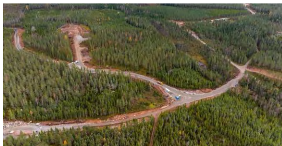
Väguppbyggnad i området för vindkraftpark Bruzaholm.

Nästa steg blir att fortsätta arbetet med vägnätet. Arbetet med att gjuta fundament kommer även påbörjas. Innan året är slut kommer ca 4-5 avjämningar att göras.