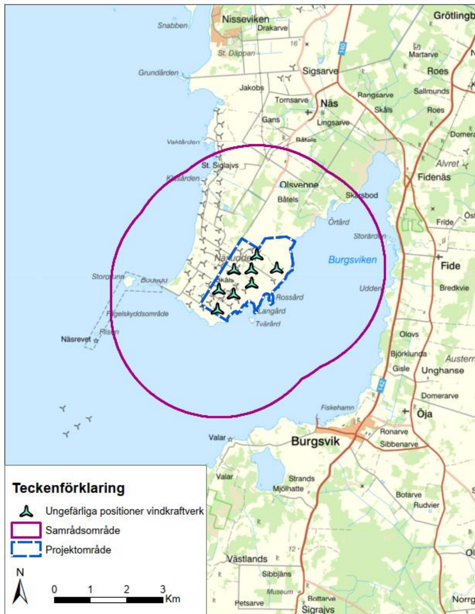
Figur 1. Karta som visar projektområdet Näsudden Öst och ungefärliga positioner för de 8 nya vindkraftverk som planeras ersätta de 19 befintliga vindkraftverken. Den lila cirkeln visar det område inom vilket utskick till fastighetsägare skett. Projektområdets utbredning kommer att justeras i ansökan och miljökonsekvensbeskrivningen.

Enligt övergångsbestämmelserna avseende det nya 6 kap. i miljöbalken bedöms samråd som genomförts innan ikraftträdandet enligt den tidigare gällande MKB-förordningen och är således giltiga. Det nya samrådet bedöms enligt de nya reglerna i 6 kap. miljöbalken och miljöbedömningsförordningen. Inget undersökningssamråd enligt det nya 6 kap. miljöbalken har genomförts (se 6 kap. 30 § tredje stycket).