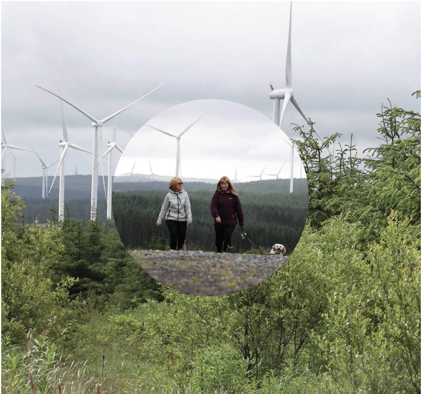
Tyfiant newydd a cherddwyr ar Fferm Wynt Pen y Cymoedd.